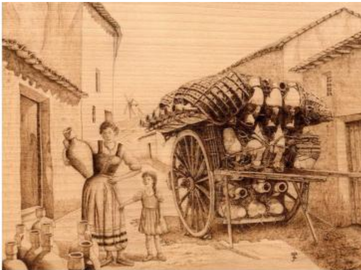
“La cantarera y la niña”

Esta medida se conservó con el paso de los siglos, y las famosas cantareras de La Mota, eran maestras en hacerlas, sin ningún tipo de medición, con esa capacidad exacta de 16 litros.