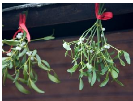
muérdago, planta de la suerte

El aguinaldo , tradicional obsequio, regalo que se realiza por Navidad es una tradición muy antigua, que se remonta al pueblo celta , costumbre conocida con