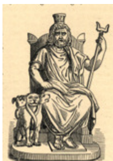
Hades dios del tenebroso mundo de los infiernos.

Pero más allá del hito de cambio de estación, los aledaños del día de los Santos se llenan de misterio y de culto a los muertos y a sus almas. Y no es algo exclusivo de las culturas mediterráneas.