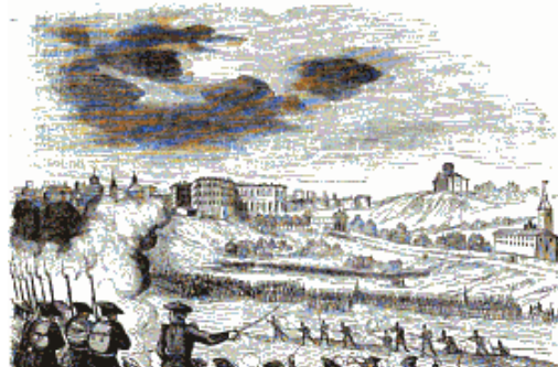
Las guerrillas de Cabrera se aproximan a las puertas de Madrid.

Cabrera continuó á ocupar su puesto avanzando hasta Vallecas con orden de no pasar adelante sin recibir nuevas instrucciones. A la media noche del referido día se empezó á dar aviso á los batallones, escuadrones y baterías de la milicia nacional de Madrid para acudir á sus respectivos puestos, y la escasa guarnición que había se preparó también á la defensa. El día 12 al amanecer entraron en Madrid los milicianos nacionales de los pueblos circunvecinos, y á las cuatro de la mañana todo estaba pronto y en el mejor estado de defensa; cada autoridad ocupaba su puesto, cada combatiente sus filas, todos los ciudadanos estaban armados, y colocada la artillería en diferentes puntos, amenazaba con la muerte á los que osasen acometer la villa de los Césares, que en este día presentaba un aspecto imponente. Se dio un decreto declarando á la provincia en estado de sitio y otras disposiciones propias á mantener el orden y seguridad.