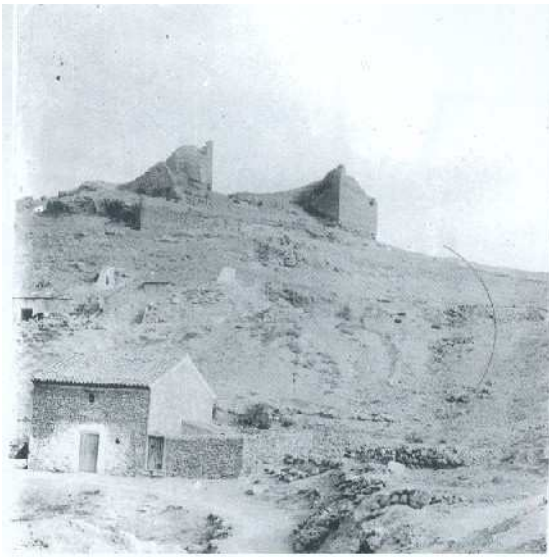
Montealegre. Ruinas del castillo

MONTEALEGRE , situado junto a la antigua Torre de Pechín, era un territorio casi despoblado y el titular debió acometer la repoblación otorgando varias cartas-puebla. Entregaba el dominio útil de las tierras y mantenía para él el dominio directo. Y lo repobló. Las tierras que, a partir de ese momento se llamarían “de Montealegre”, y que permanecerían integradas en el Señorío de Villena. Una zona con fuerte presencia mudéjar frente a las tierras colindantes de Almansa y Yecla, repobladas con cristianos procedentes de la serranía conquense.