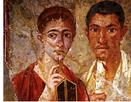
El Panadero Paquius Próculo. Pompeya S. I

La profesión de panadero era muy bien considerada durante el periodo del Imperio romano, como sostén de abastecimiento de un alimento básico a la población creciente que poco a poco dejaba de ser rural. Paquius Proculus , que perteneció al gremio de panaderos llegó a ser alcalde de la ciudad de Pompeya.