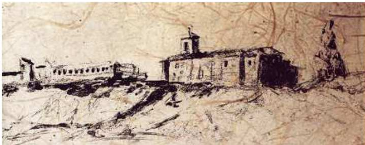
Las cuestas. Vista desde el camino del boleo