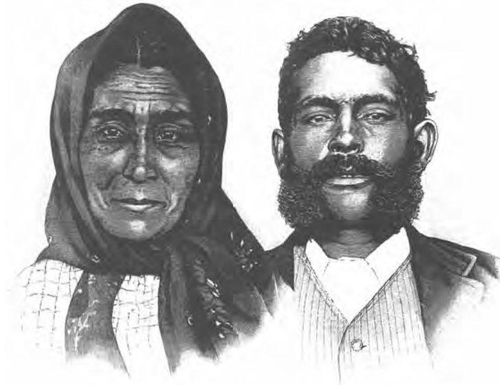
Escritos sobre gitanos (Portada)

Se le comunica que debe tomar oficio en un plazo de dos semanas. Y según informa el Alcalde, pocos días después, “ se dedicaría a comerciar en frutas y vidriado (“Vedreao.”) para traerlo a vender a la ciudad. ”.