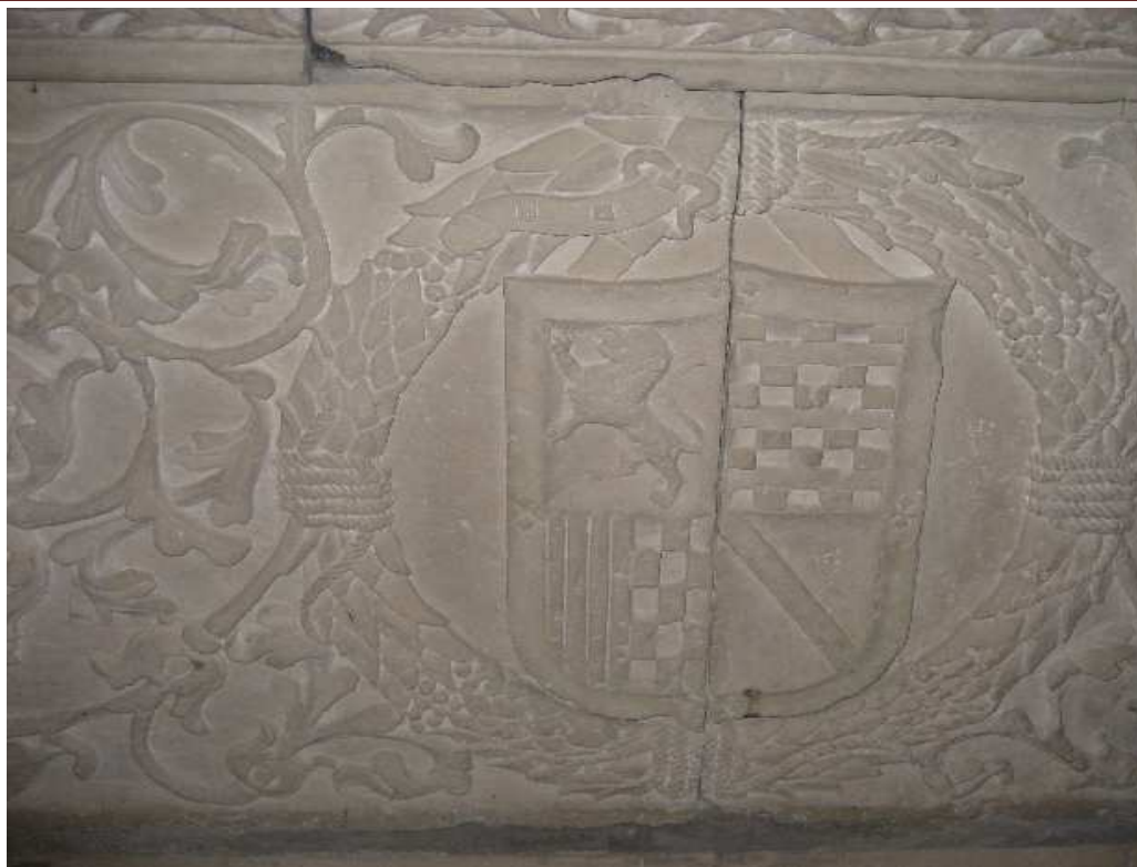
Frontal del Cenotafio .

En esta capilla debieron ubicarse las lápidas con los restos de los Señores de Montalbo. Dos se han conservado hasta nuestros días.