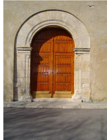
Puerta del sol

Actualmente son dos las puertas de entrada, siendo la principal, la única en uso, la del muro Norte. La puerta del muro Sur, la puerta del sol , ha estado siempre fuera de uso, poco menos que clausurada. Una y otra conservaban el cancel , especie de contrapuerta, de tres hojas, una al frente, doble, y dos laterales. Cerrado todo por un techo, para evitar ruidos e impedir la entrada del aire. En los años 70, era de obra en ambas, pero que en su origen sería de madera como todos los de la zona.