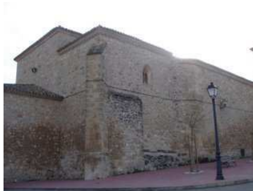
Contrafuertes a los pies y en la cabecera de la iglesia de Santo Domingo de Silos. Montalbo