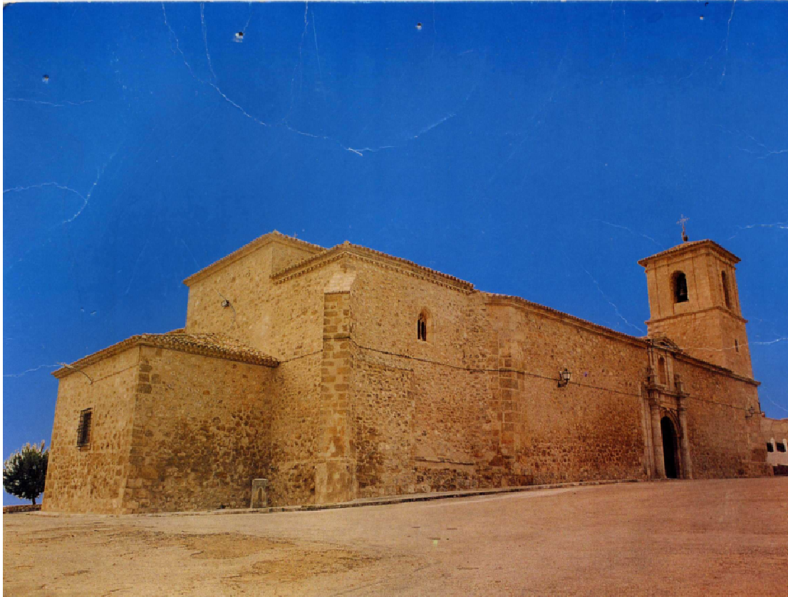
Iglesia parroquial de Santo Domingo de Silos. Montalbo