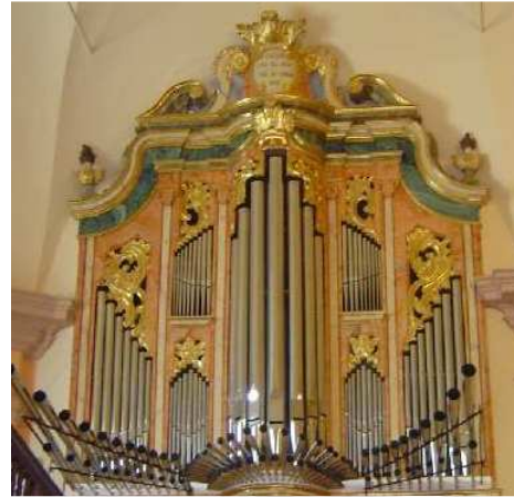
Órgano de Villar de Cañas.

Era, con toda probabilidad, obra del mismo maestro organero, JULIÁN DE LA ORDEN uno de los más ilustres maestros organeros de la catedral de Cuenca. Maestro organero del siglo XVIII, de Barchín del Hoyo. Que trabajó en los órganos de la parroquial de Fuente de Pedro Naharro, 1736, y, por los mismos años, en la iglesia de Cervera.