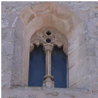
Ventana en el muro norte

El sistema de iluminación natural se resolvió con ventanas y óculos. Ventanales en la parte Sur-Este para recoger la luz del día. En el muro Oeste y sobre el Coro existía, y existe, una ventana lobulada.