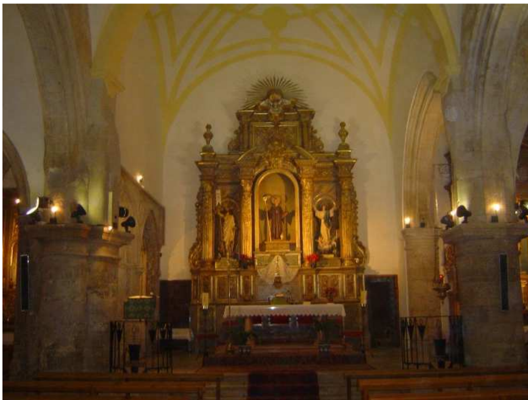
Presbiterio y Altar Mayor de la Parroquial de Montalbo

En la cabecera de la nave central, El PRESBITERIO tiene forma de capilla cuadrada tan común a finales del s. XVI, cuando las capillas poligonales góticas ceden progresivamente su puesto a las cabeceras lisas, rectangulares o planas que facilitaban la colocación de retablos.