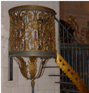
Púlpito en el Monasterio de Uclés.

Adosado a una de las columnas existió un Púlpito , especie de tribuna elevada en las iglesias desde donde predicaban los sacerdotes. Era éste una plataforma circular de barras de hierro forjado, colgado de una de las columnas anteriores de la nave central. Se accedía a él por medio de una escalera, también de hierro, cerrada al paso, en la parte inferior. Allí esperaba al sacerdote uno de los monaguillos hasta acabado el sermón. Posiblemente, en su origen, dispuso de tornavoz , a modo de sombrero. Si lo tuvo, carecía de él en los años sesenta. Desapareció a la vez que las rejas del baptisterio.