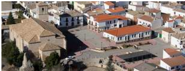
Vista aérea de la Iglesia y la “Vicaría”

El paraje era conocido en su tiempo, con el nombre de La Vicaría. Así se referían al lugar los vecinos nacidos a principios del 1900. Mi abuelo así lo recordaba, y con ese nombre lo citaba, incomprensiblemente para mí, refiriéndose, no sólo a la Iglesia, sino, también a los terrenos aledaños.