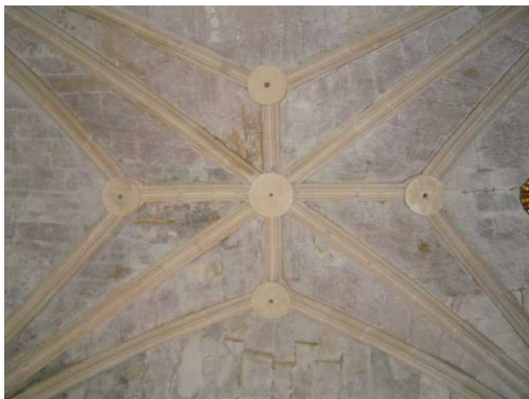
Techo de la bóveda . Capilla de los Coello.

La entrada, desde la nave Norte, con su arco apuntado. Los dos arcos bellamente ornamentados, que dan acceso al Presbiterio. Y la bóveda. La capilla se cubre con bóveda estrellada.