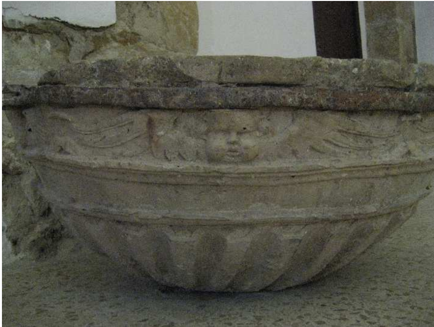
Antigua Pila Bautismal

Hasta la reforma llevada a cabo en los años setenta, una verja de hierro cerraba el recinto. Reja que, en su origen, sería de madera, según las disposiciones episcopales al respecto: “todas las pilas de bautizar estén cubiertas por cobertores de madera... y cuando las pilas estuvieren en algún rincón de la iglesia, mandamos que alrededor de ellas se pongan rejas de palo que tengan su puerta y cerraja, para que en el tiempo en que no se bautiza, ninguno se llegue a la pila.