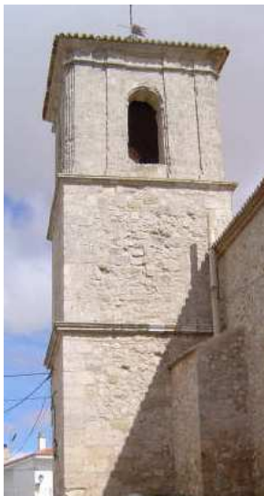
Torre de la iglesia de Montalbo

Sólo dos campanas, al Norte y al Este, ocupan sus cuatro vanos.