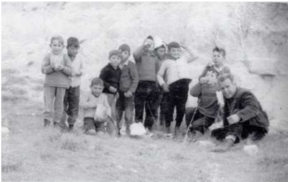
Jueves Lardero en Montalbo. 1963