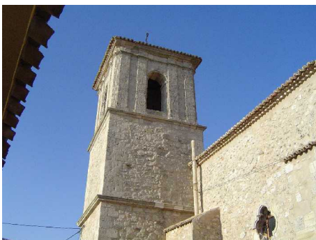
Iglesia de Montalbo

En el Colegio de los Jesuitas de Villarejo de Fuentes estudió Gramática. Pasó después a la Universidad de Alcalá, donde estudió Filosofía y Derecho Civil y Canónico con tan notable éxito en sus estudios que a los 19 años recibió los grados de Licenciado en Leyes y Cánones.