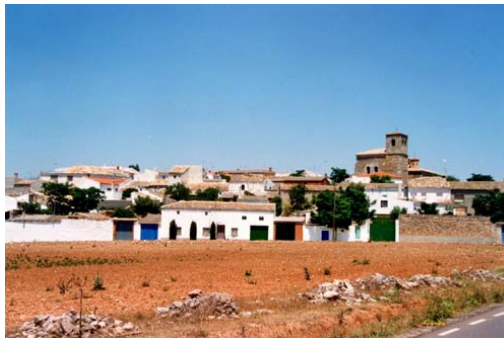
El Hito. Vista

Fueron sus padres D. Domingo Vázquez Tablada (natural de El Hito) y D a Josefa Blanco (natural de Montalbo), ilustres personas de la comarca.