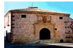
Pósito de Campo de Criptana

Ya apuntaba Jovellanos que “los campesinos apenas comen lo indispensable”. ( Informe sobre la Ley Agraria ). Y, en 1883, un estudio confirma que “ muchos braceros del campo no comían carne y, si por una casualidad la ingerían, les hacía daño y no podían digerirla ”.