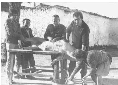
Matanza en Villar de Cañas.

La alimentación del pobre, en el campo, era fundamentalmente vegetal; la del rico, en las capitales, animal.