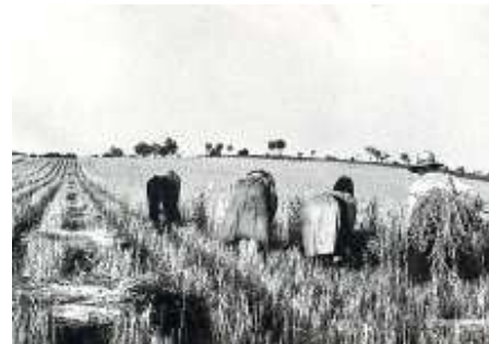
Segadores en Tresjuncos

Como no segaban nunca una fanega, sino las 4/5 partes, el amo reducía la ración en igual proporción.